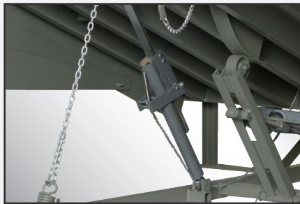
Mecanismo de sujeción del tambor de oscilación, margen extendido y para servicio pesado.