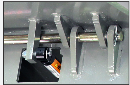
Plataforma de "construcción de caja" con un diseño de bisagra tipo orejeta para servicio pesado.