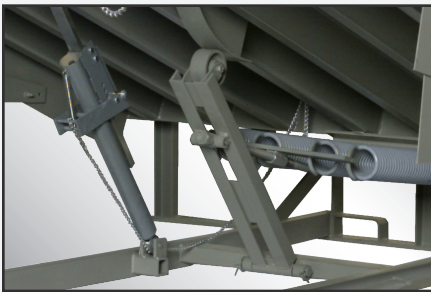
El conjunto equilibrador Cam Control permite que la rampa se extienda suavemente y que el nivelador baje fácilmente.