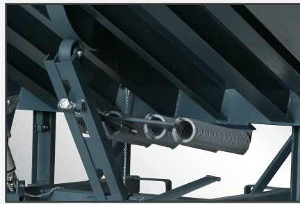
Conjunto principal de resortes ajustable en un punto con construcción de rodillo y leva.