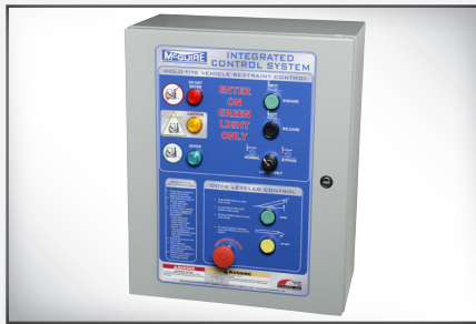
Panel de control integrado opcional para el nivelador, el retenedor y la cortina.