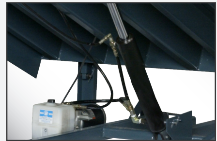
Los cilindros de puerto doble permiten que el líquido hidráulico se desplace en ambas direcciones en un sistema regenerativo.