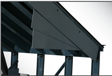
Guardapiés de estilo deslizante de alcance completo para una mayor seguridad.