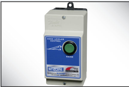
El panel de control Nema 4 de McGuire acepta todos los requisitos de voltaje monofásico y trifásico