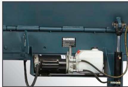
Cómodo montaje del motor y la bomba debajo del muelle/andén con depósito translúcido para un mantenimiento fácil