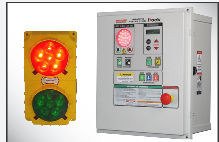
iDock Controls incluyen comunicación por luces y que se pueden integrar con cualquier otro equipo de andén.