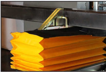
El motor y la bomba autónomos de PowerStop® se pueden montar de manera remota.